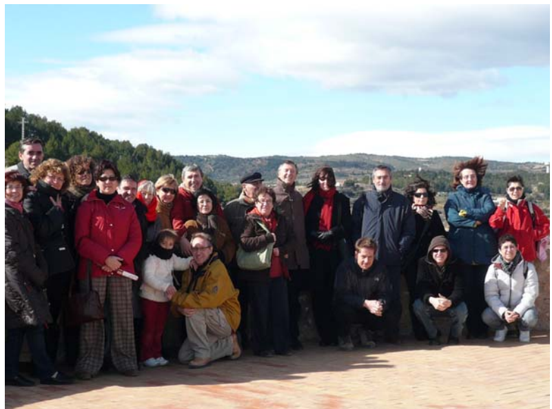
El grup, dalt de la torre del Botxí

Una excursió que ens acostà a una ciutat que, amb un patrimoni monumental molt destacable, és una gran desconeguda malgrat la proximitat. I que mereix més d'una visita per perdre's pels carrerons i places de la part antiga.