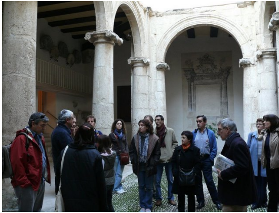
pati del museu de l'Almodí

L a primera eixida de l'associació ha estat a Xàtiva . Val a dir que va haver-hi una pro- toactivitat consistent en una memorable calço- tada l'any passat (només perquè conste en acta).