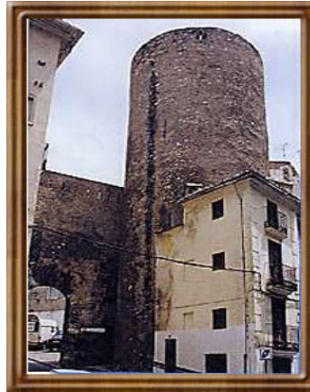
Torre de la Càrcel i l'aqüeducte

La visita a la ciutat episcopal la férem acompanyats d'un guia local. Començà-