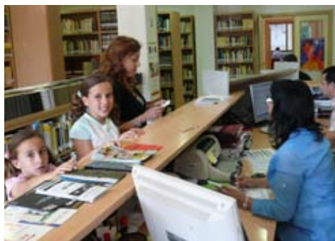
● Al taulell de préstec de la Biblioteca

mi. Ara trastejaven entre les prestatgeries dos persones, que posaven tota la seua energia i il·lusió a fer de mi una biblioteca en majúscules. I dos anys després, el 1995, encara m'augmentaren la plantilla: i aquella altra persona també es preocupava de mi i m'obria les portes, no solament de vesprada sinó també de matí. Així tenia més visites i coneixia més gent, que primer es passejaven al teu costat, Barranc, i després entraven a les meues sales. Ho