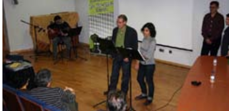
• Un moment de la presentació amb alguns dels protagonistes.

Gràcies a totes les persones que ens acompanyàreu en la presentació de l'associació, que ja és vostra també. Vam sentir que arribàvem a molta gent i això fa goig.