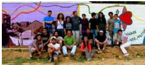
● Alguns dels participants en la pintada dels murals de la diversitat

La Plataforma per la Convivència –creada a Paiporta en el mes de gener amb el suport de partits polítics, associacions de mares i pares de les escoles, i associacions culturals, musicals i esportives del nostre poble– pretén apuntalar, en època de crisi, els valors de la nostra socie-